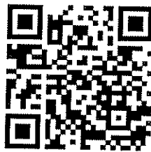
(แบบประเมินก่อน)

๑. ขอความร่วมมือผู้เข้าสอบทำแบบประเมินความเสี่ยง โดยให้สแกน QR Code หรือเข้าไปที่ https://forms.gle/zkDMwqs2BakODz4h6 และตอบคำถามตามความเป็นจริง เพื่อการคัดกรองเบื้องต้น ก่อนวันประเมินความรู้ ความสามารถ ทักษะ และสมรรถนะ (สอบข้อเขียน) ภายในวันที่ ๖ สิงหาคม ๒๕๖๔ เพื่อนำข้อมูลมาใช้ประโยชน์ในการดำเนินการสอบคัดเลือก และจัดเตรียมสถานที่สอบสำหรับผู้เข้าสอบ